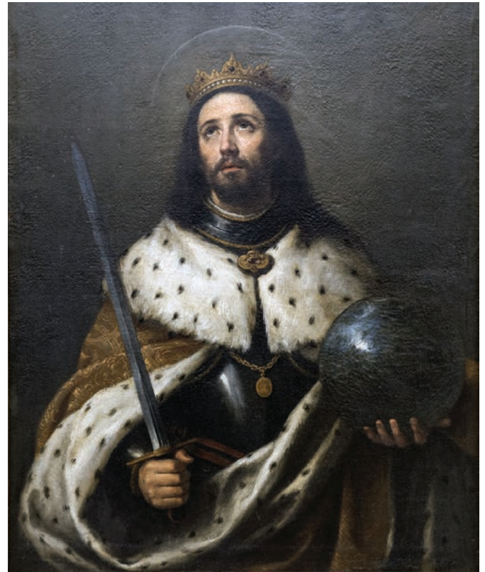
imagen un sentido ascendente, que queda reforzado por la mirada dirigida al cielo del Santo y por la espada.

El Santo Rey se recorta sobre un fondo oscuro y aparece representado de medio cuerpo a tamaño natural, como un hombre maduro en actitud contemplativa. La obra muestra una composición triangular, que confiere a la