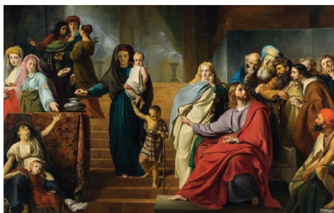
“El óbolo de la viuda”. Francois Joseph Navez (1840)

das más que nadie. Porque los demás han echado de lo que les sobra, pero esta, que pasa necesidad, ha echado todo lo que tenía para vivir».