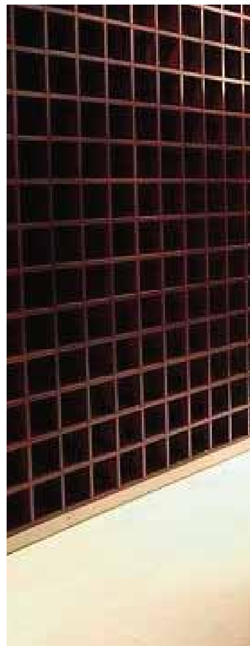
Columbario de la Hermandad del Cachorro.

El incremento de incineraciones en los últimos años ha hecho necesaria la regulación de las mismas, por lo que en 2006 se actualizó el Reglamento Diocesano de Columbarios del 2 de noviembre de 1999, con el objetivo de que los fieles pudieran encontrar mayor facilidad a la hora de depositar adecuada y dignamente las cenizas de sus seres queridos, tal y como corresponde a su condición de cristianos.