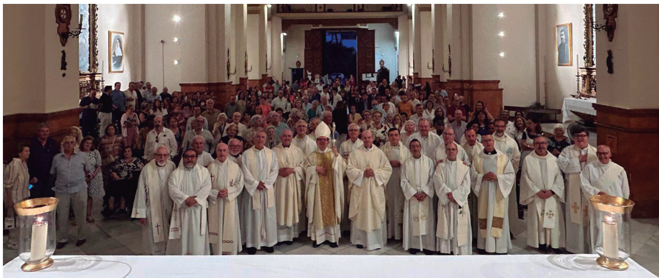
Eucaristía de clausura de la visita pastoral al arciprestazgo de San Bernardo, en la Parroquia del Corpus Christi. En la página anterior, Eucaristía de clausura de la visita pastoral al arciprestazgo de Morón de la Frontera, en la Parroquia de San Miguel, de Morón.

al Señor, conociéndolo y trabajando desde el anuncio del Evangelio, cada uno dentro de sus posibilidades”.