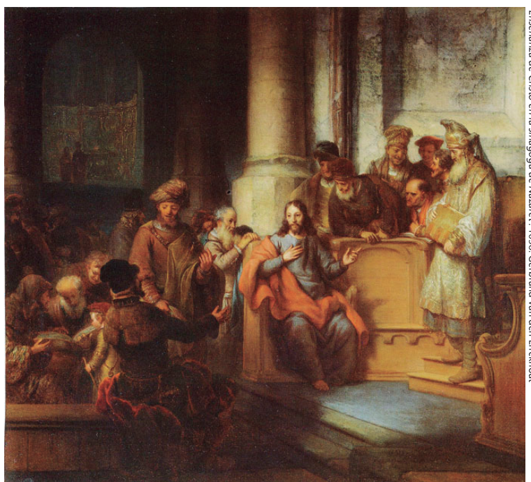
Enseñanza de Cristo en la sinagoga de Nazaret. 1658. Gerard van den Erckhout

Y recorría los pueblos de alrededor enseñando.