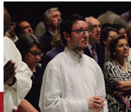
- Lezajsk, Polonia (1993) - Seminarista del 5º curso del Seminario Metropolitano de Sevilla

Es la escena de la Anunciación la que suscita en él una especial ternura. “Me ha llamado la atención el sí de María y su disposición a hacer la voluntad del Señor, aunque no siempre le parecía clara”. Asimismo, la esencia del lema jesuita ‘En todo