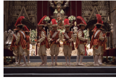
Jueves de Corpus en Sevilla