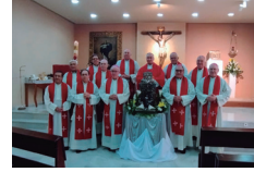
Asamblea de los Obispos del Sur de España