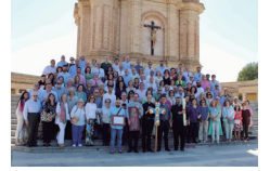
Cursillo de Cristiandad nº 800 en Sevilla

nº 389- Semana del 26 de mayo al 1 de junio de 2024