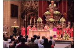
Vigilia diocesana de Pentecostés en la Catedral

nº 387- Semana del 12 al 18 de de mayo de 2024