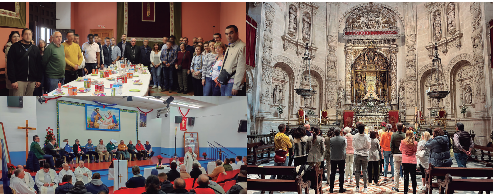
A la izq. visita de los reclusos del hospital psiquiátrico penitenciario al arzobispo de Sevilla (mayo de 2024). Debajo, misa de Navidad en Sevilla I. A la dcha, visita organizada por la Delegación de Pastoral Penitenciaria a la Catedral de Sevilla.