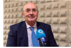
Nuevo delegado de Pastoral Penitenciaria