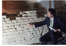
Hallazgos en la iglesia de Santa María la Blanca