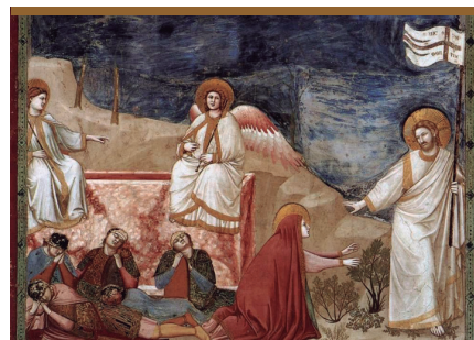
III. Jesús Resucitado se manifiesta a María Magdalena (Jn 20,11-18)