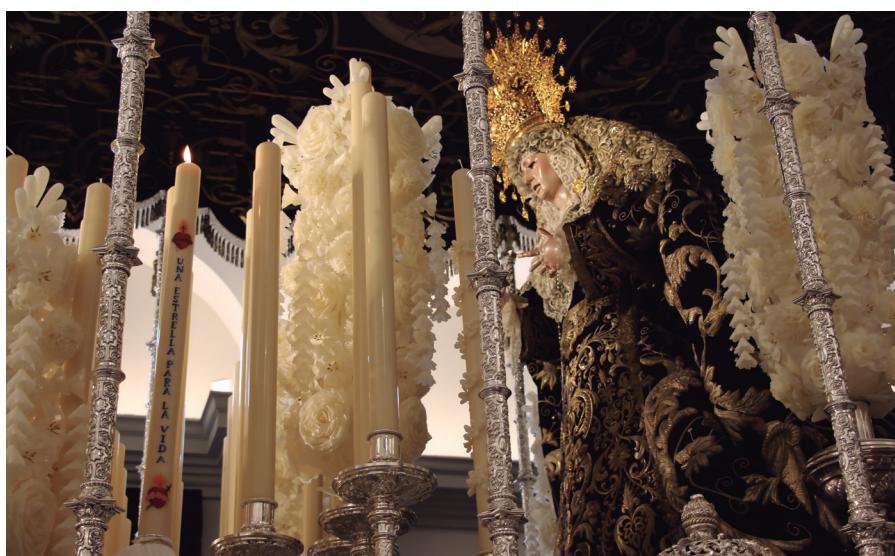
El cirio de los donantes de órganos en el palio de M a Stma. de la Estrella, patrona de los transplantados de corazón