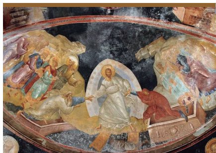
I. Jesús resucita de la muerte (Mt 28-16)