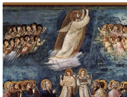
XII. El resucitado sube a los cielos (Hchs 1, 6-11)