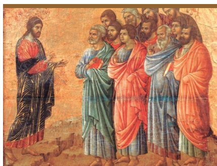
XI. Jesús Resucitado le confía a los discípulos la misión universal (Mt 28,16-20)