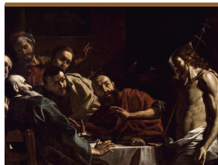
VI. Jesús se presenta vivo entre los discípulos (Lc 24, 36-39)