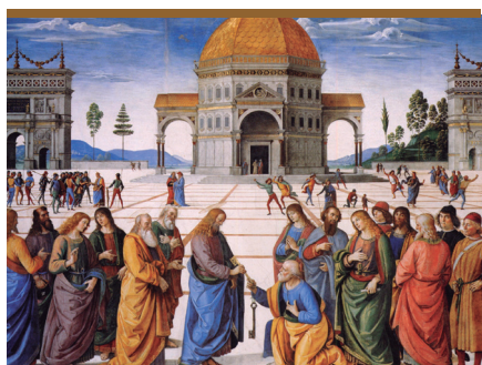
X. Jesús Resucitado confiere el primado a Pedro (Jn 21, 1-9.13)