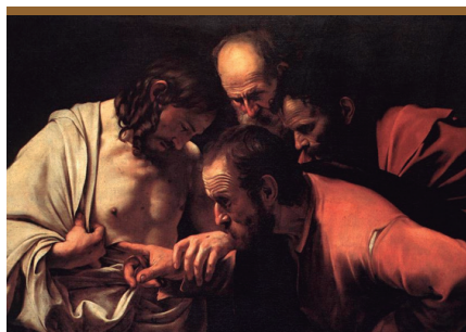
VIII. Jesús Resucitado confirma la fe de Tomás (Jn 20, 24-29)