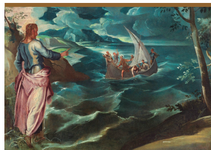
IX. Jesús Resucitado se muestra a los discípulos en el Tiberiades (Jn 21, 1-9.13)