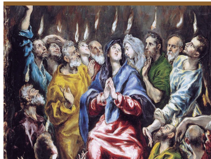
XIV. Jesús resucitado envía a los discípulos el Espíritu Santo prometido (Hchos 2, 1-6)