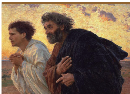
II. Los discípulos encontraron el sepulcro vacío (Jn 20, 3-8)