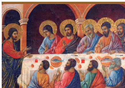
VII. Jesús resucitado da el poder de perdonar los pecados (Jn 20, 21-23)