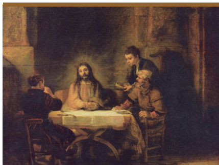
V. Jesús se manifiesta en el partir el pan (Lc 24,28-35)