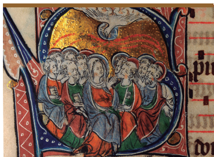
XIII. Con María a la espera del Espíritu (Hchs 1, 12-14)