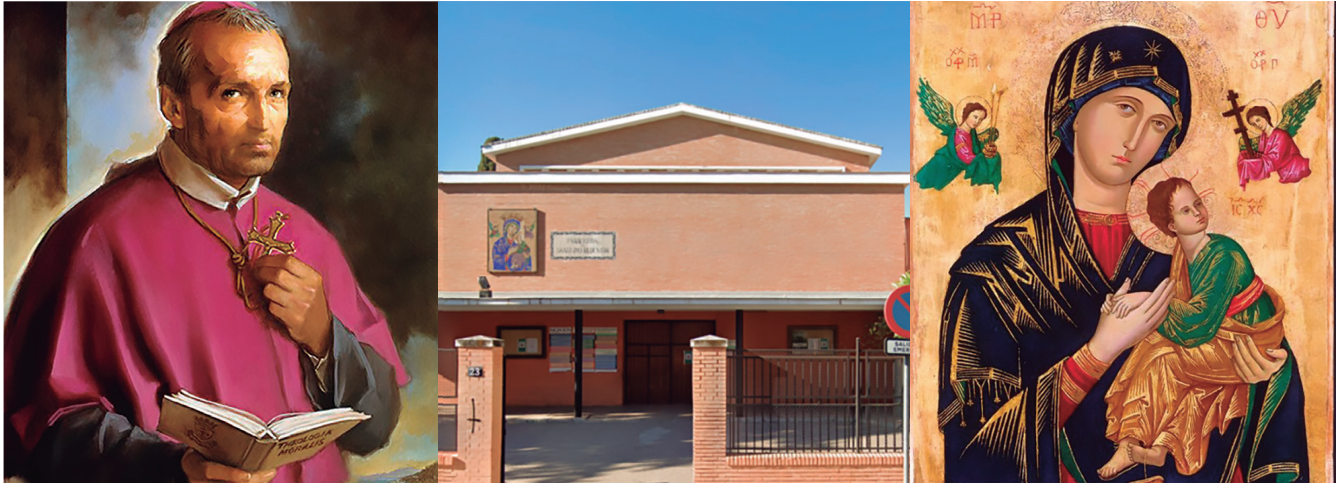
De izq. a dcha. , San Alfonso M a de Liguorio; Parroquia del Stmo. Redentor (Sevilla); Virgen del Perpetuo Socorro

La Congregación del Santísimo Redentor (redentoristas) fue fundada por san Alfonso María de Liguorio en 1732. Alfonso tenía entonces 36 años. Había sido un abogado de éxito que abandonó los tribunales para hacerse sacerdote y dedicarse a atender a los más pobres y abandonados de la ciudad de Nápoles y su entorno.