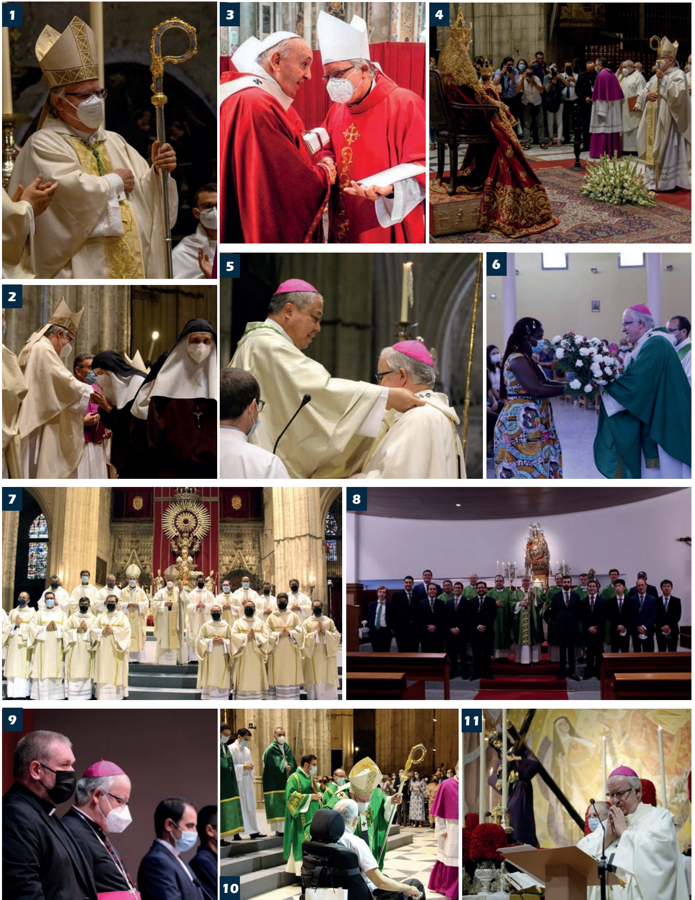
1 y 2. Toma de posesión como arzobispo de Sevilla (12/6/21). 3. Bendición de los palios arzobispaes en el Vaticano (29/6/21). 4. Solemnidad de la Asunción de la Virgen (15/8/21). 5. Imposición del palio arzobispal a Monseñor Saiz en la Catedral de Sevilla (11/9/21). 6. Jornada del Migrante y del Refugiado, en la Parroquia de Ntra. Sra. de Lourdes (26/9/21). 7. Ordenaciones diaconales y sacerdotal (18/9/21). 8. Toma de Cruces de los seminaristas de nuevo ingreso (19/9/21). 9. Inicio de curso de la Facultad de Teología (7/10/21). 10. Eucaristía de inicio de la fase diocesana del Sínodo, en la Catedral (18/10/21). 11. Eucaristía en la Parroquia de Santa Teresa, por la Misión del Gran Poder (2/11/21).