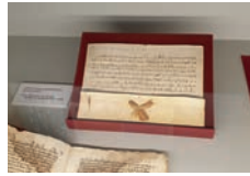
Muestra sobre Alfonso X el Sabio