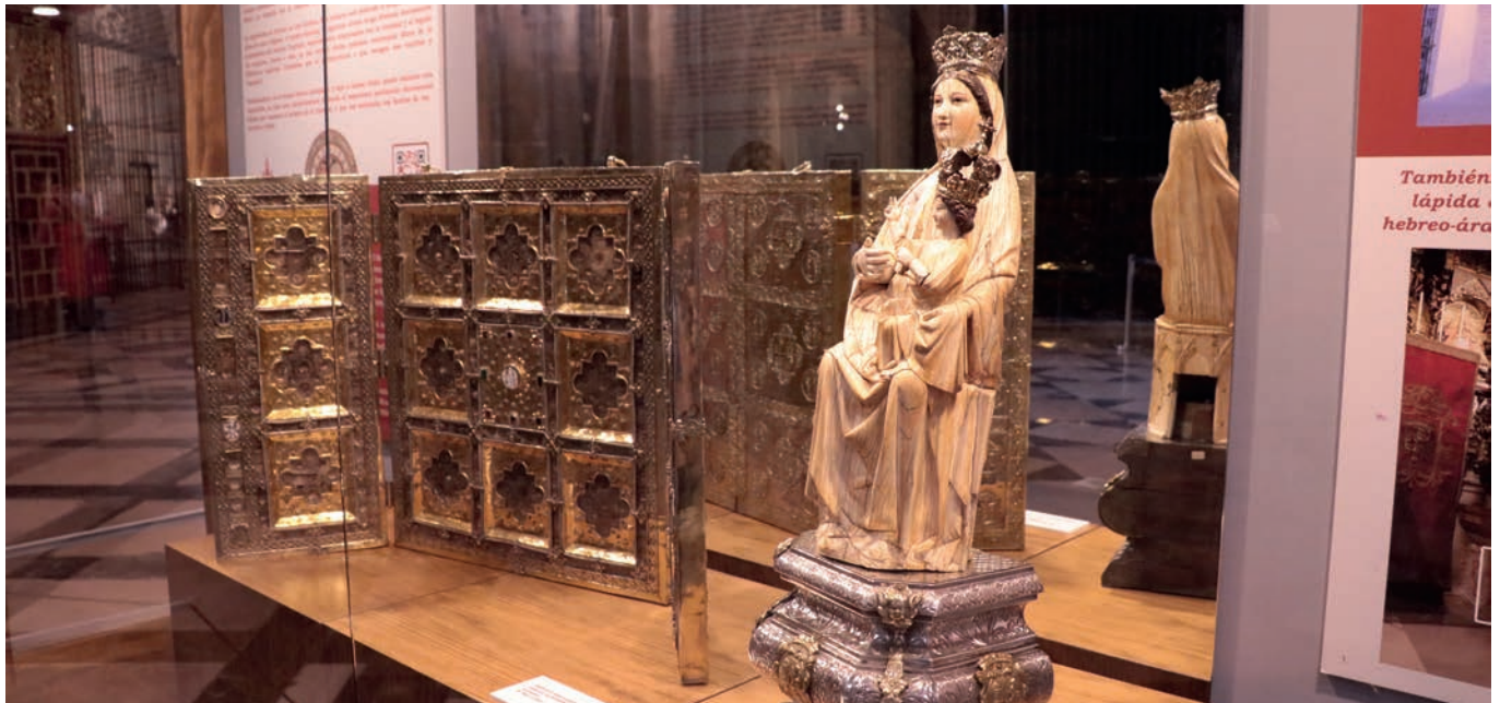
En la muestra de la Catedral pueden contemplarse las 'tablas alfonsíes' y Virgen de las Batallas.

La Iglesia en Sevilla celebra durante el mes de junio dos exposiciones simultáneas con las que rinde homenaje al rey Alfonso X con motivo del VIII centenario de su nacimiento.