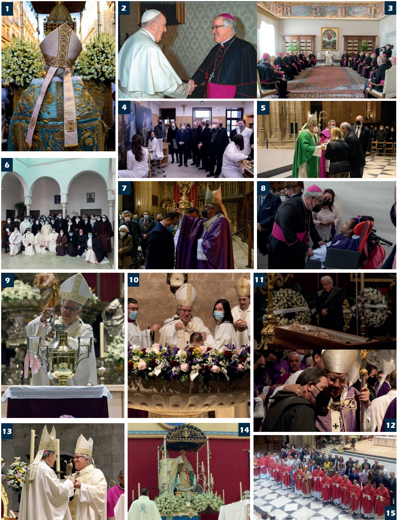
1. Procesión extraordinaria de la Virgen de los Reyes (7/12/21). 2 y 3. Visita Ad Limina (21 al 25/1/22). 4. Visita al Taller de Restauración diocesano (14/1/22). 5. Bodas de oro y plata matrimoniales, en la Catedral (19/02/22). 6. Encuentro con religiosas de clausura (28/1/22). 7. Miércoles de Ceniza, en la Catedral. (3/3/22). 8. Semana Santa 2022. 9. Misa Crismal, en la Catedral (12/4/22). 10. Vigilia Pascual (16/4/22). 11 y 12. Fallecimiento del cardenal Amigo (27 a 30/4/22). 13. Celebración de San Juan de Ávila, en la Catedral (12/5/22). 14. Coronación de Ntra. Sra. de Escardiel (23/5/22). 15. Vigilia diocesana de Pentecostés (4/6/22).