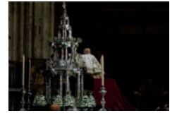
Sevilla se prepara para celebrar el Corpus Christi

nº 299- Semana del 12 al 18 de junio de 2022