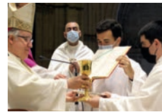
Duc in altum: 'Ocho nuevos sacerdotes'